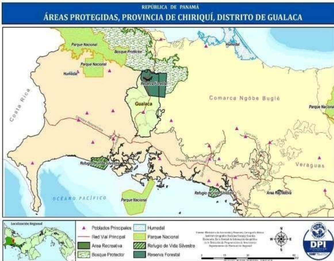
MAPA N° 4. ÁREAS PROTEGIDAS, DISTRITO DE GUALACA.

La flora que se puede observar en el Distrito es variada, encontrándose: bosque secundario, donde predominan las especies de hábitat como el: nance, cusca, carmera, rampala, montaña, matillo pelú, raspalengua o jobito, almácigo, laurel y cedro. El Bosque de Galería se ubica a lo largo de la mayoría de los cursos de agua de la hidrografía del distrito de Gualaca. Las especies representativas de este hábitat son: el algarrobo, barrigón, rosa del monte, jobo y espavé. En el Distrito de Gualaca, luego de la construcción de los Proyectos Hidroeléctricos de Estí y Dos Mares, se han realizado forestaciones y reforestaciones de distintas áreas adyacentes a las zonas donde se ubican las represas y canales de ambos proyectos. Los árboles plantados, pertenecen a diversas especies frutales y maderables, donde predomina un gran bosque de Texas. Dentro del Sistema Nacional de Áreas Protegidas, (SINAP), en Panamá se encontraban establecidas un total de trece (13) reservas forestales, en el año 2010, una de las cuales es la Reserva de Fortuna.