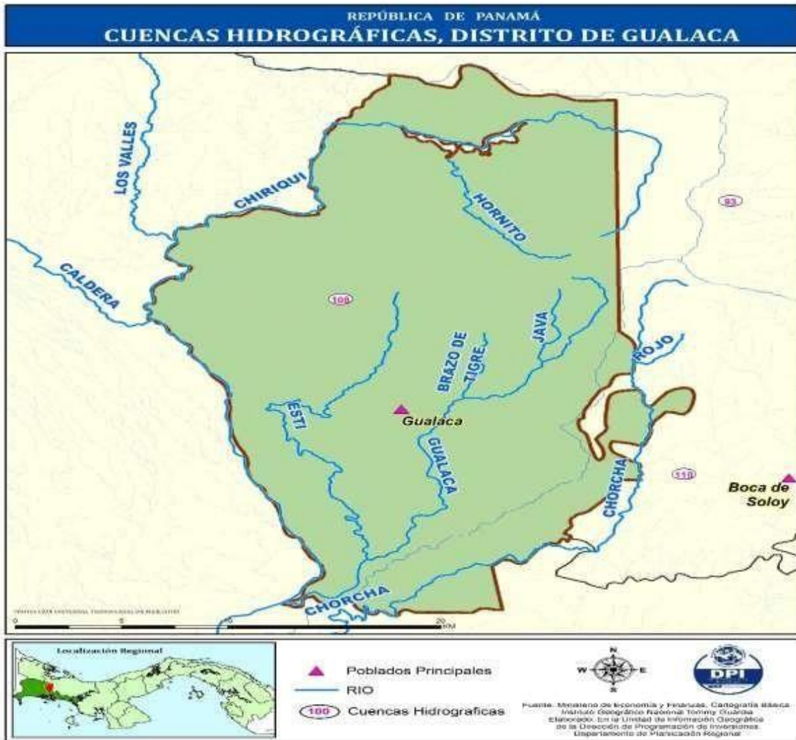
MAPA N° 3. CUENCAS HIDROGRÁFICAS, DISTRITO DE GUALACA.

Utiliza las aguas turbinadas o descargadas de la hidroeléctrica Fortuna con la adición de las aguas fluyentes desviadas de los Ríos Caldera, Chiriquí y Quebrada Barrigón y el Complejo Hidroeléctrico Dos Mares, el cual actualmente es operado por la Empresa CELSIA y que a su vez reutiliza el agua que fluye por el cauce del Río Estí, luego de su salida en la casa de máquinas del Complejo Estí.