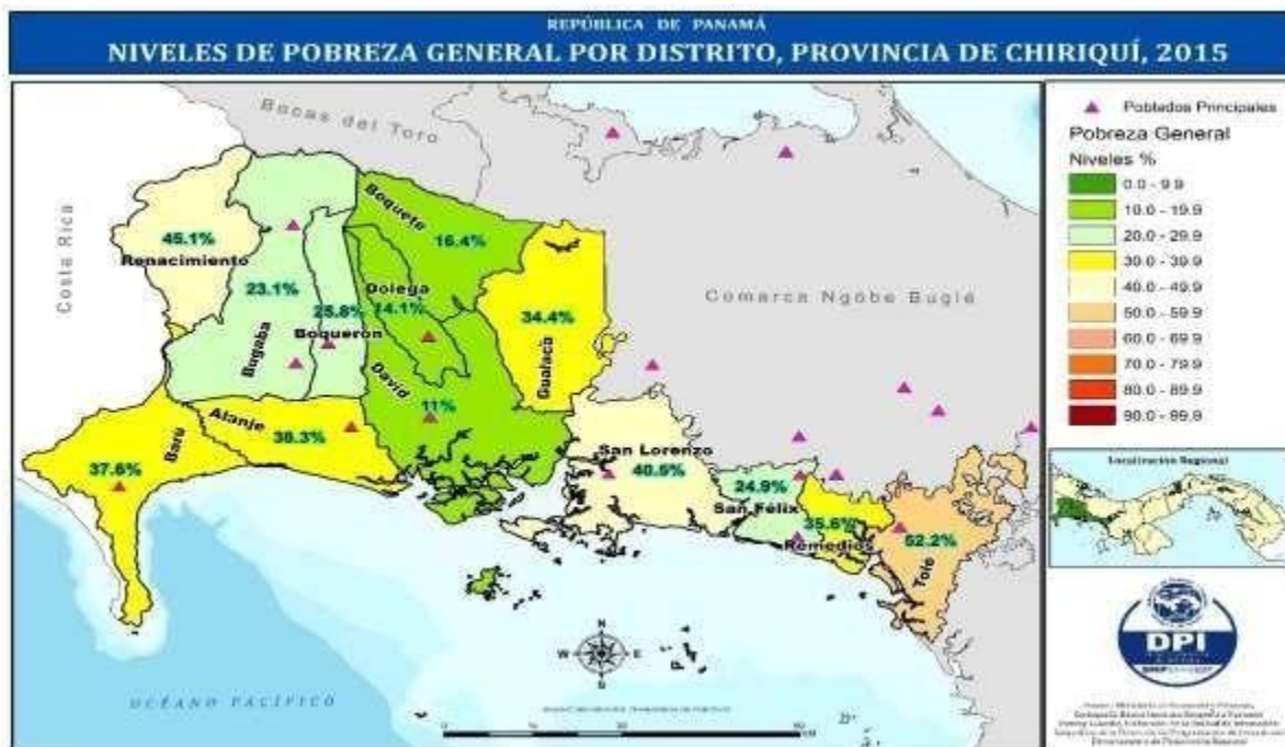
MAPA N° 7. NIVELES DE POBREZA GENERAL, DISTRITO DE GUALACA.

Según el Informe de Pobreza y desigualdad en Panamá, año 2015 presentado por el Ministerio de Economía y Finanzas la pobreza general en el distrito de Gualaca ocupa la posición N° 38 a nivel Nacional en pobreza general con un total de 3,531 persona en condición de pobreza, el cual representa el 34.4% del total de la población, la severidad de pobreza es 0.7%. Y en cuanto la pobreza Extrema ocupa la posición N° 37 a nivel nacional con un total de 1343 caso de pobreza esto representa el 13.1% de la población.