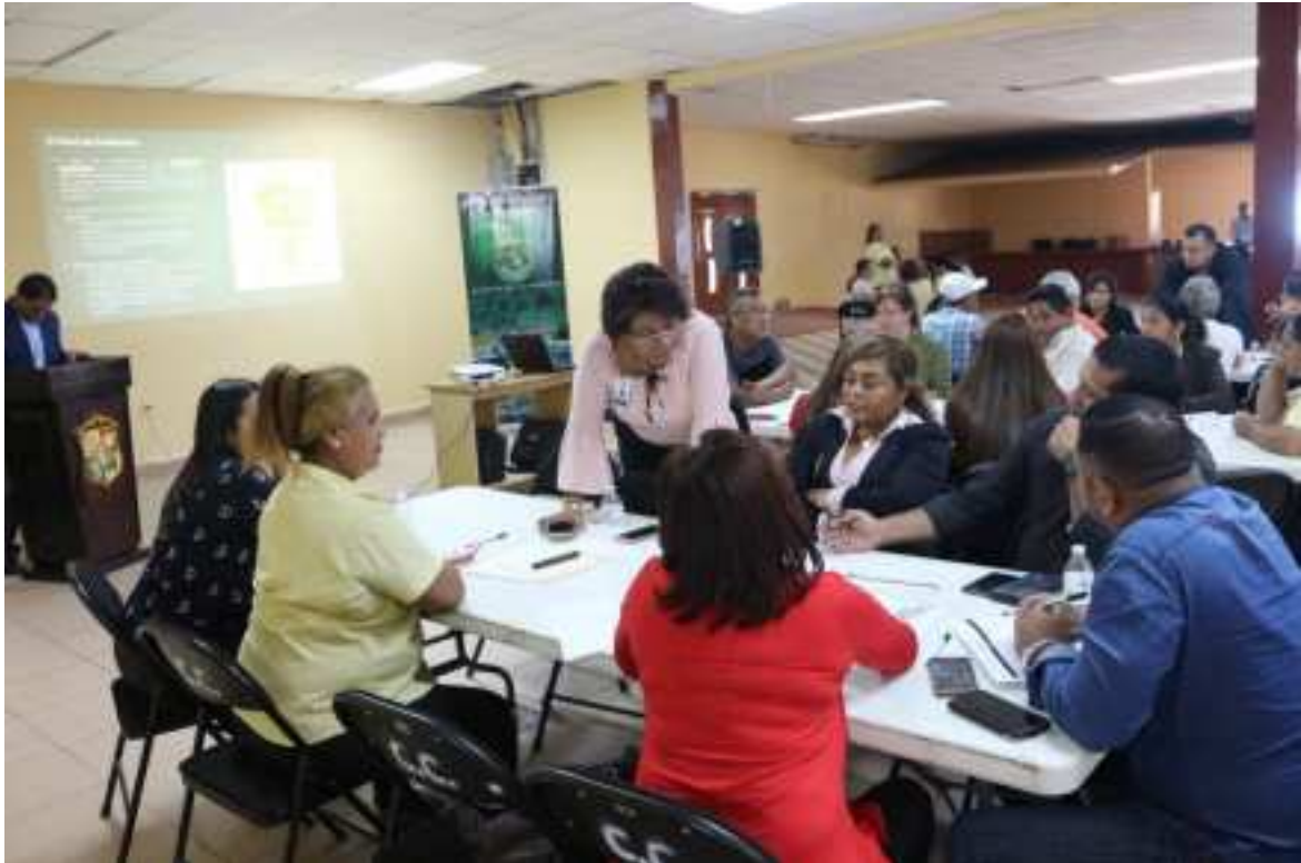
Mesa de trabajo de la Dimensión Urbana-Semi Urbana - Rural