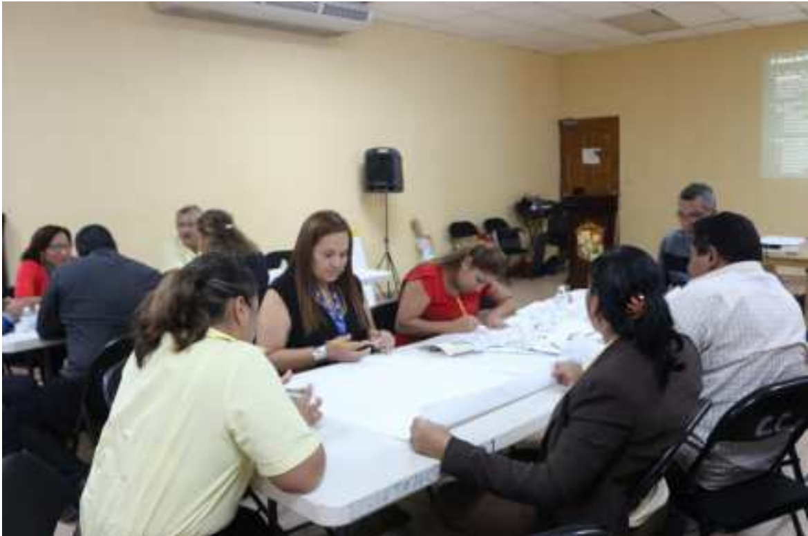
Mesa de trabajo de la Dimensión Económica