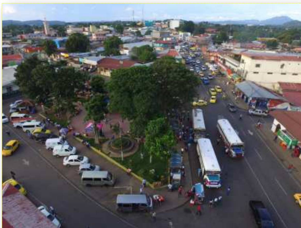
Vista panorámica del Parque Feuillet.

Una vez desarrollado el diagnóstico distrital e identificado las Fortalezas, oportunidades, Debilidades y Amenazas, nos avocamos a precisar las acciones que deben tomarse en cuenta para hacer los correctivos necesarios y enrumbar la estrategia hacia el logro de los objetivos, es decir que este ejercicio ha permitido la ruta de las gestiones y coordinaciones que el Municipio de La Chorrera debe tomar en cuenta para la administración de competencias que le sean trasladadas.