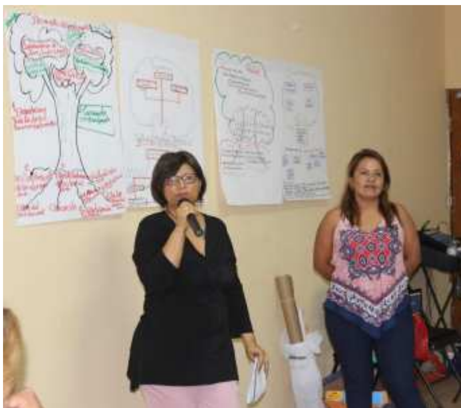
Técnico del MI AMBIENTE explicando el resultado de la mesa de Físico Ambiental.