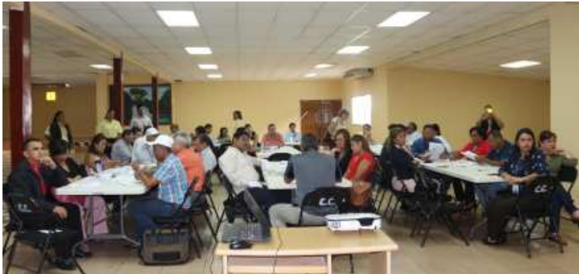
Conformación de las mesas de trabajo y explicación de la metodología para la validación del diagnóstico distrital según dimensión.