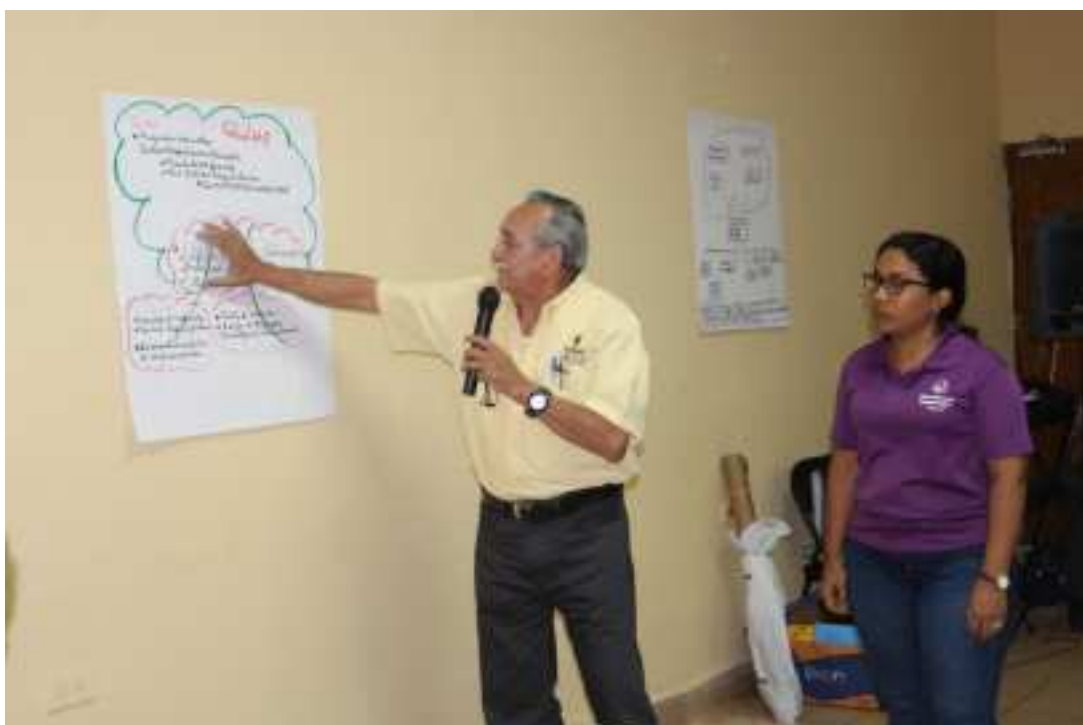
Técnico del MINSA explicando el resultado de la mesa de salud.