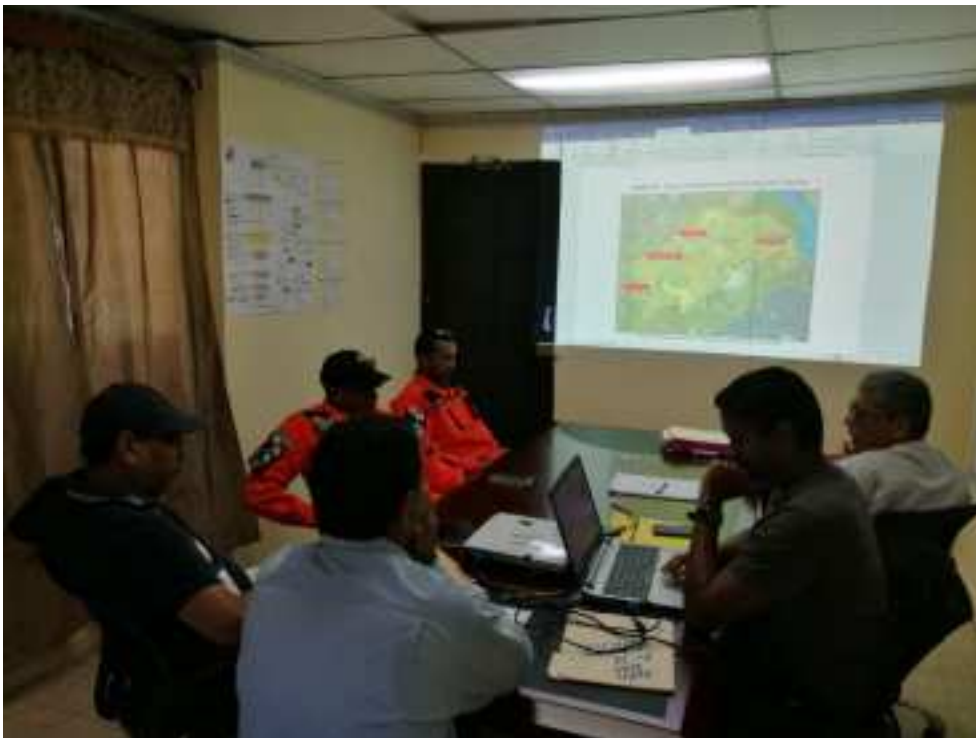
Explicación de las áreas de alto riesgo y de afectación por inundación Con el equipo de prevención de riesgo Municipal