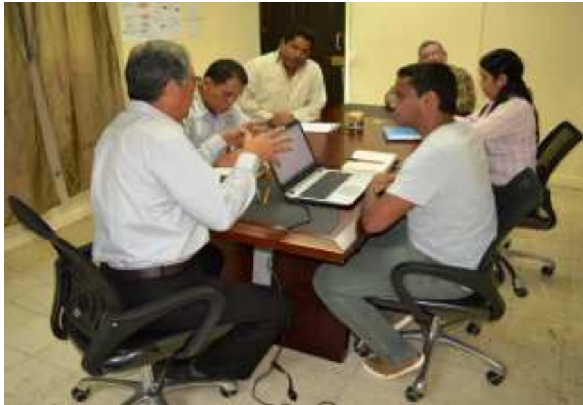
Parte del proceso, de la aplicación metodológica compartida con el personal técnico del MEF.