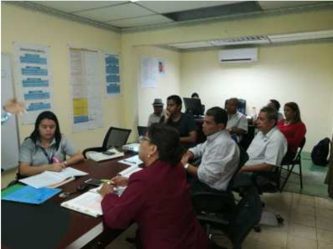
Taller de trabajo con los jefes de departamentos de asuntos Municipales