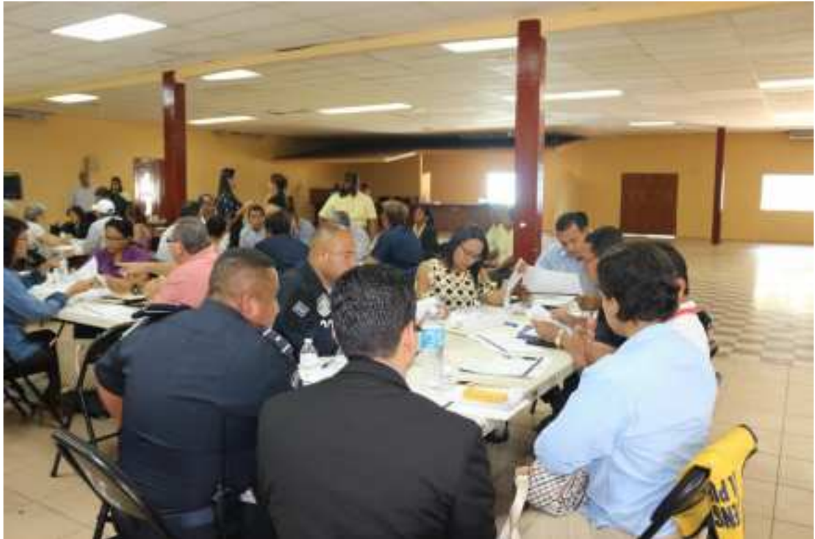
Mesa de trabajo de seguridad ciudadana