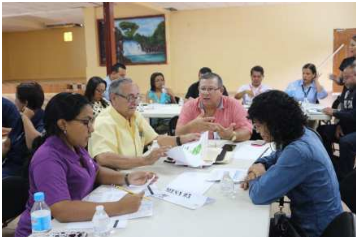
Mesa de trabajo de la dimensión de salud.