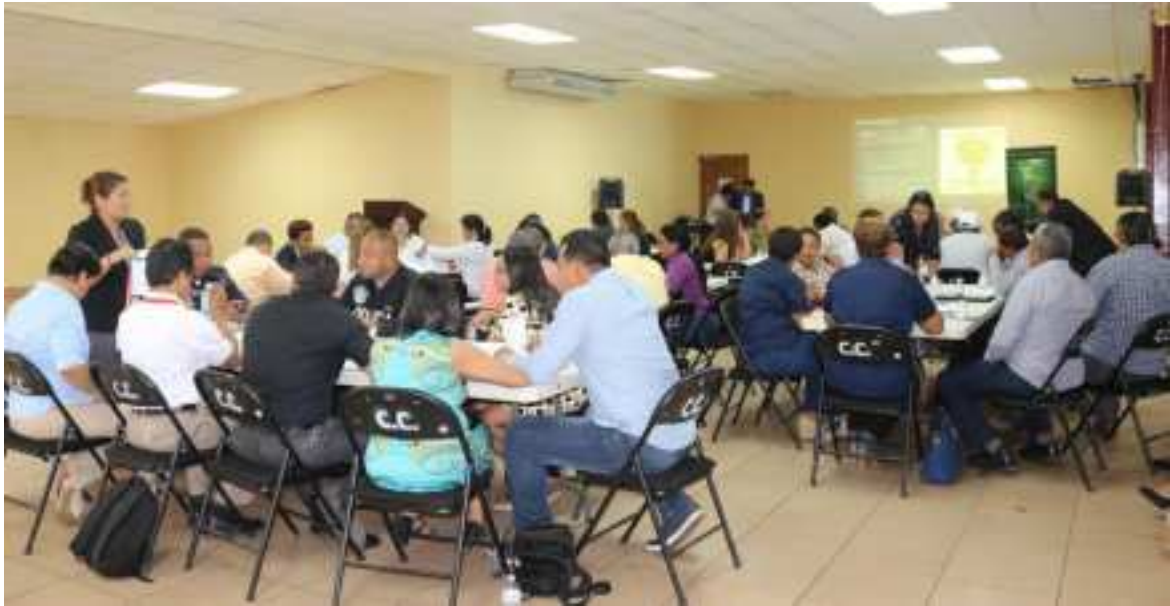
Mesas de trabajo atendidas por técnicos del MEF en el taller de validación del diagnóstico distrital.