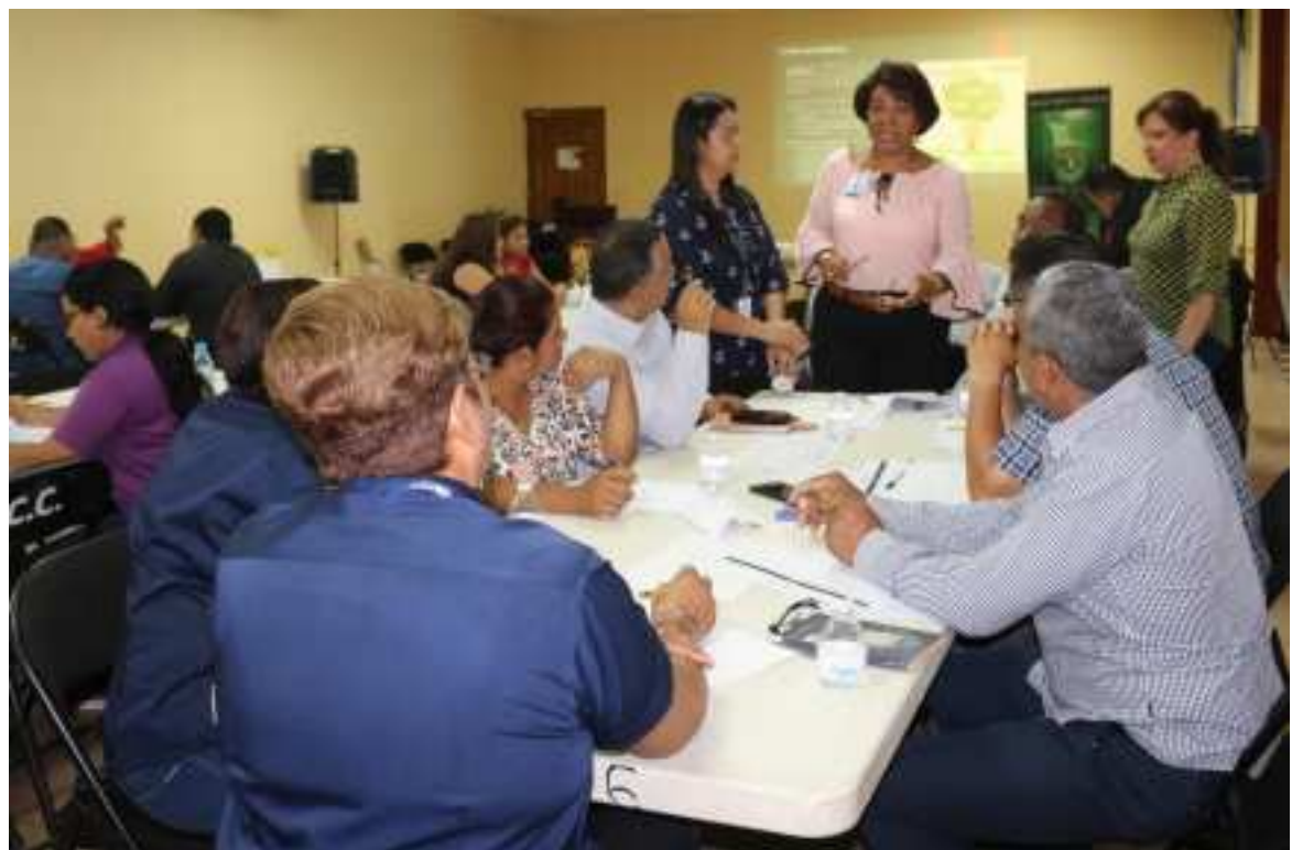
Participación de H.R y de la SND en la mesa de trabajo jurídica-institucional