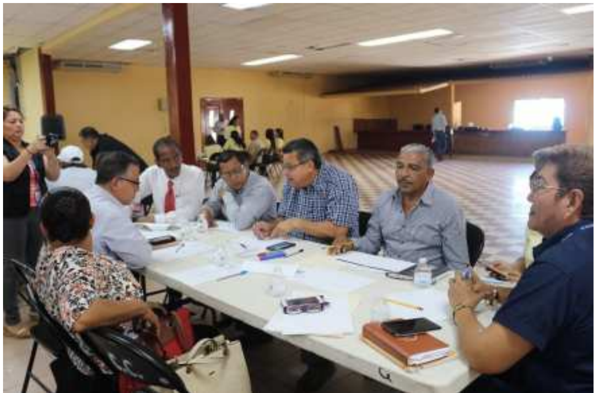
Honorables Representantes participando en la discusión de estrategias municipales.