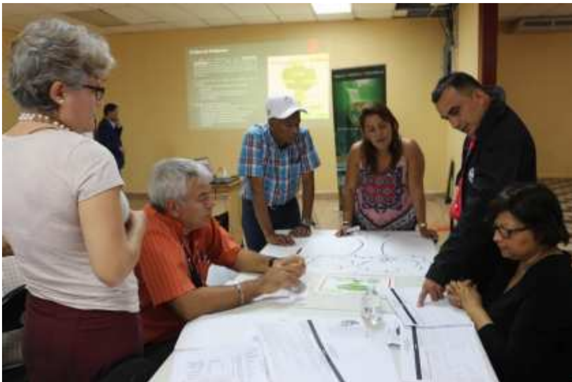
Mesa de trabajo de la Dimensión Físico Ambiental