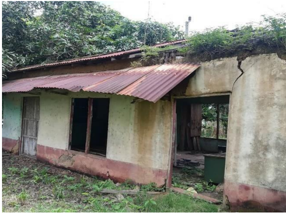
Escuela de El Tábano - Paritilla

Se debe tomar en cuenta que al largo del Distrito se pueden contemplar estructuras pertenecientes al Ministerio de Educación que actualmente son obras ruinosas y que si se pudieran utilizar para beneficio de la comunidad se podrían instaurar salones comunales y de capacitaciones para la población de las diferentes comunidades.