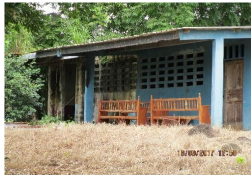
Escuela La Madera

Una escuela en el Corregimiento de Paritilla, una escuela en el corregimiento de Pocrí y una en el corregimiento de Paraíso; quedando solamente Cañafístulo con sus dos escuelas operantes.