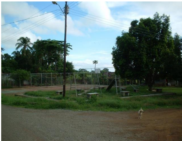
Cancha de La Candelaria

Solicitaríamos que nos consideren para construcción de canchas sintéticas y de que nos apoyen en la restauración de las canchas en existencia dentro del Distrito.