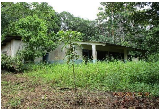
Escuela de Los Cerros

Actualmente son seis las escuelas abandonadas en el Distrito y estas no reciben mantenimiento por parte del MEDUCA, quedado convertidas en escombros y obras peligrosas para los moradores de las comunidades, estamos hablando de tres escuelas en el corregimiento de Lajamina: