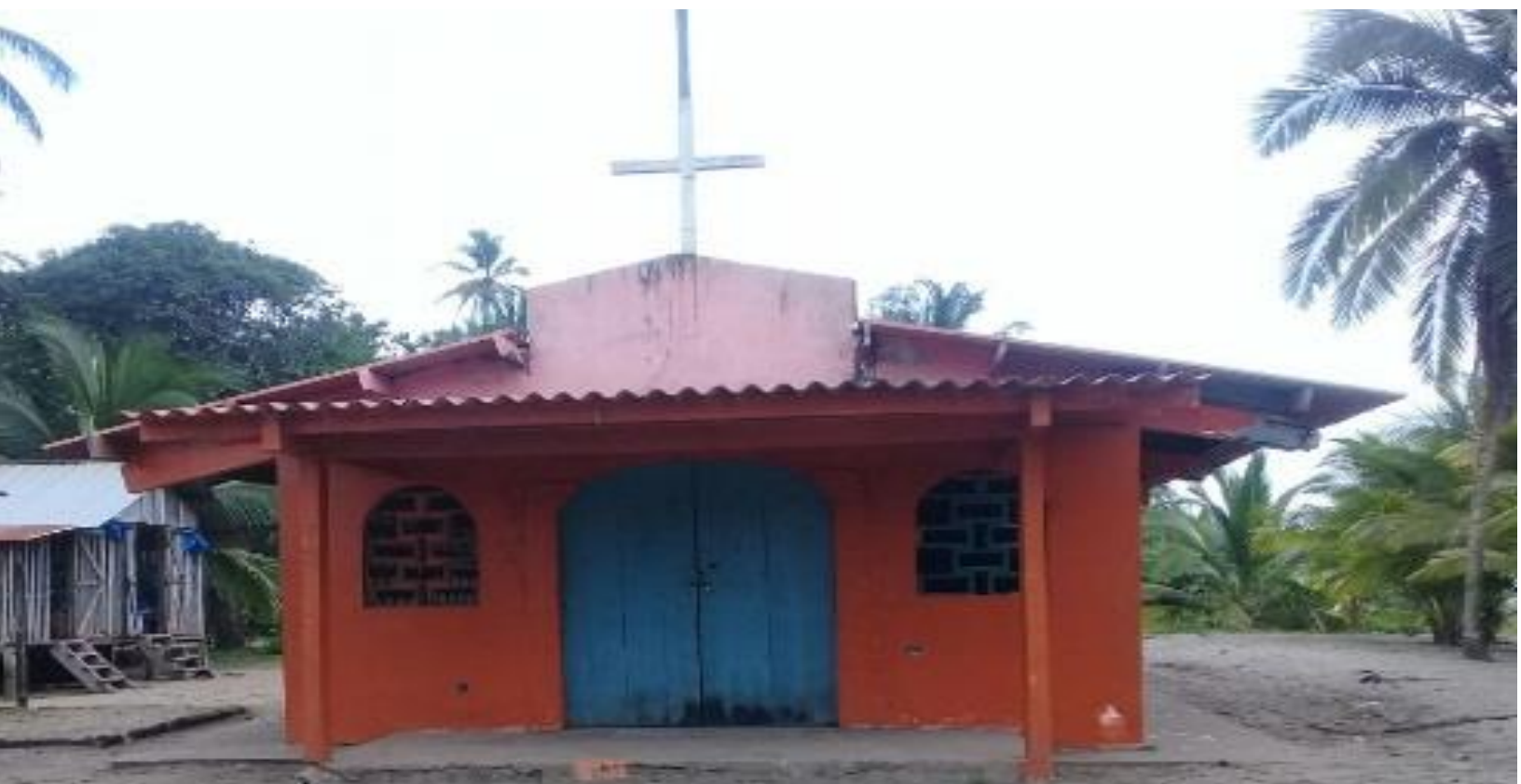
Vista de la iglesia de la comunidad