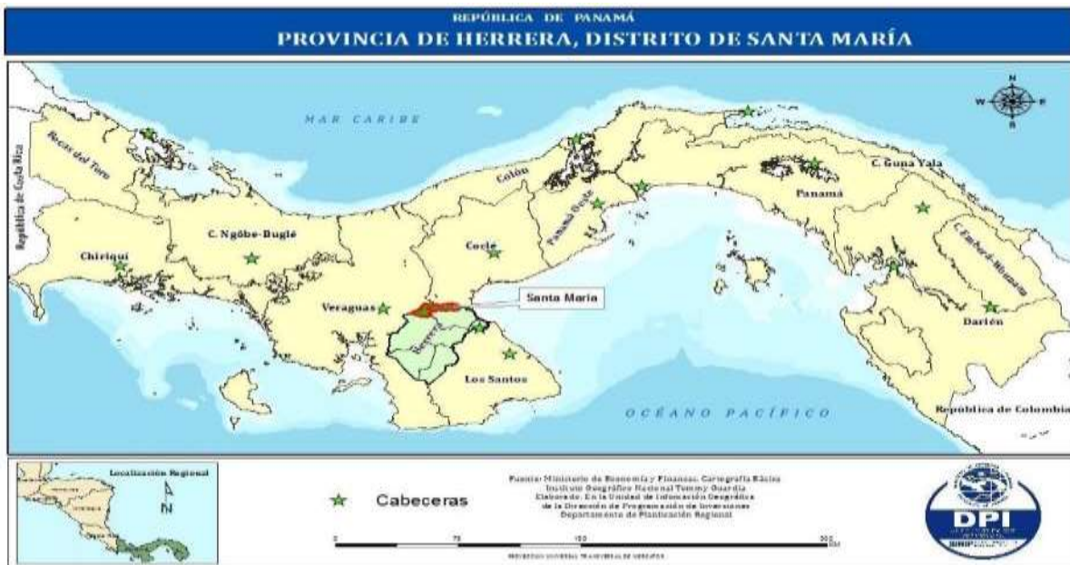
MAPA No. 1 UBICACIÓN DEL DISTRITO DE SANTA MARÍA, AÑO 2017

El distrito de Santa María se encuentra ubicado en la provincia de Herrera, limitando al Norte: Con el distrito de Aguadulce (provincia de Coclé), al Sur: Con el distrito de Ocu, al Este: Con el distrito de Santiago (provincia de Veraguas) y al Oeste: Con el distrito de Parita.